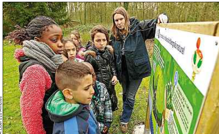
Des écoliers lillois ont participé à l'atelier compost en forêt de Phalempin.